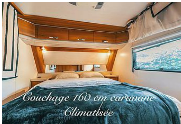
Couchage 160 cm caravane Climatisée